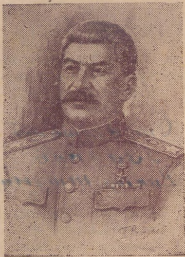
Верховный Главнокомандующий Маршал Советского Союза И. В. СТАЛИН.

За форсирование реки Неман и прорыв сильно укрепленной обороны противника на западном берегу Немана .