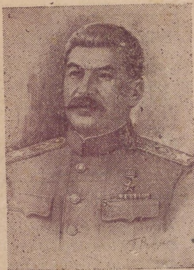
Верховный Главнокомандующий Маршал Советского Союза И. В. СТАЛИН.