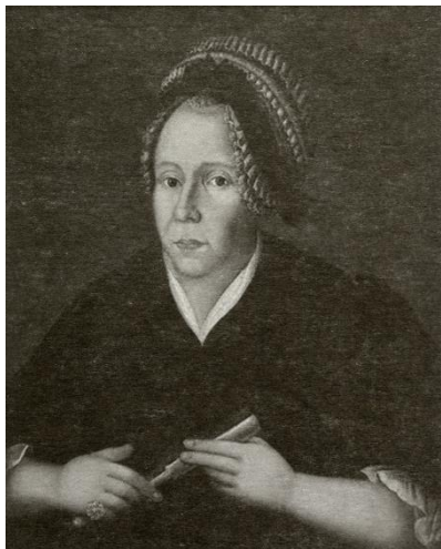
Неизвестный художник XVIII века. Портрет Елизаветы Васильевны Радищевой (урожд. Рубановской)

Известен портрет младшей сестры Анны Васильевны – Елизаветы (1757–1797) . Он находится в Государственном литературном музее (г. Москва), опубликован в последнем издании Боголюбовских «Записок моряка-художника».