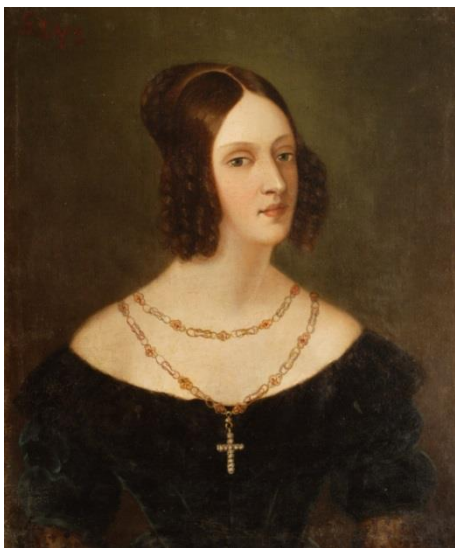
Неизвестный художник XIX века. Портрет масляными красками неизвестной дамы в костюме 1830-х годов