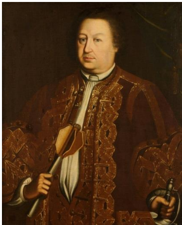
Неизвестный художник XVIII века. Портрет А.П. Радищева.