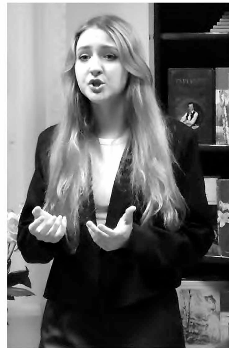
Выступление участницы конкурса в старшей возрастной группе.

Конкурс был объявлен 23 октября, проходил он в два этапа. Участниками второго, заключительного этапа, стали 29 человек в трёх возрастных номинациях. Младшая группа – 5-6 классы, средняя группа – 7-8 классы, старшая группа – обучающиеся 9-11 классов и студенты. Самое активное участие в конкурсе, как сообщила Е.В. Казакова, приняли КМК, школа № 6 имени кузнецан-защитников Донбасса, школа № 4 им. Е. Родионова, школы №№ 3, 10, 15, гимназия № 9.